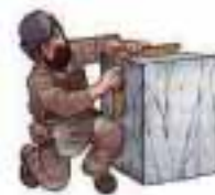
Con su mandil y las herramientas de trabajo, el picapedrero cubica su piedra bruta.

Recuerde visitar las web-site realizadas por la revista Hiram Abif